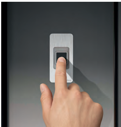
Entriegeln der Tür per Fingerprint ...