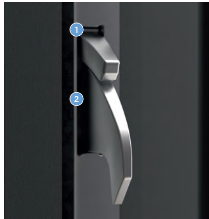
Tür geschlossen: Dichtungselement aktiviert, Schwenkriegel fährt aus und greift tief in die Schließleiste ein.