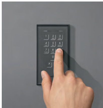
... per Keypad ...