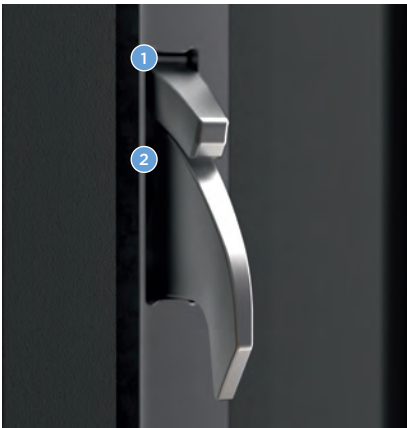
Schwenkriegel-Duo verschließt automatisch.

Aufgrund ihrer arretierenden Sicherheitsschwenkriegel mit Hinterkrallung verleiht die Automatik-Türverriegelung autoLock AV4D Haustüren eine hohe Einbruchhemmung. Mit AV4D M4 kann in entsprechend stabilen Türelementen durch die zusätzlichen Sicherheitsriegel problemlos die Klasse RC2 erreicht werden.