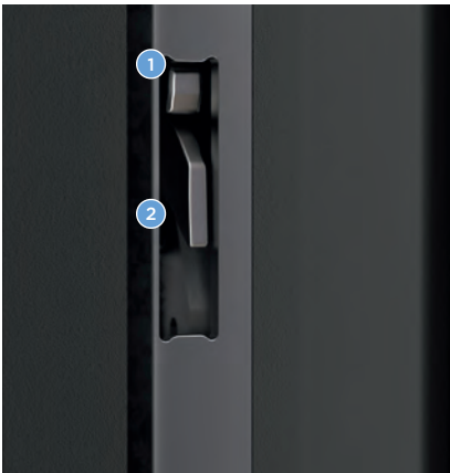
Tür geöffnet: Dichtungselement und Schwenkriegel eingefahren.