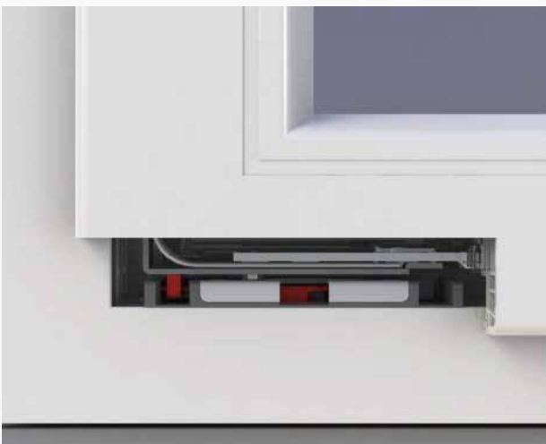
03 Fenster ist geschlossen und verriegelt. Der 8-Kant-Verschlussbolzen hinterkrallt beim Verschließen das Sicherheitsschließblech und der Tresorbolzen verriegelt mit dem Fensterflügel. Ein Aushebelschutz von bis zu einer \frac{1}{2} Tonne gewährleistet höchste Sicherheit.

Der neue und exklusive RWS Tresorbolzen wurde entwickelt, um Einbrecher effektiv am Eindringen in Ihr Haus zu hindern und ist standardmäßig in allen RWS Fenstern enthalten.*