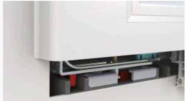
02 Fenster ist geschlossen, jedoch noch nicht durch den Tresorbolzen verriegelt