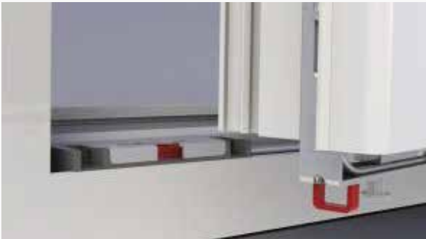
01 Fenster ist offen und der Tresorbolzen geöffnet

im Ansatz durch einen Aushebelschutz von bis zu einer \frac{1}{2} Tonne . Diese einzigartige Technologie hindert Einbrecher effektiv am Eindringen in Ihr Haus und schützt Sie somit auf höchstem Niveau.